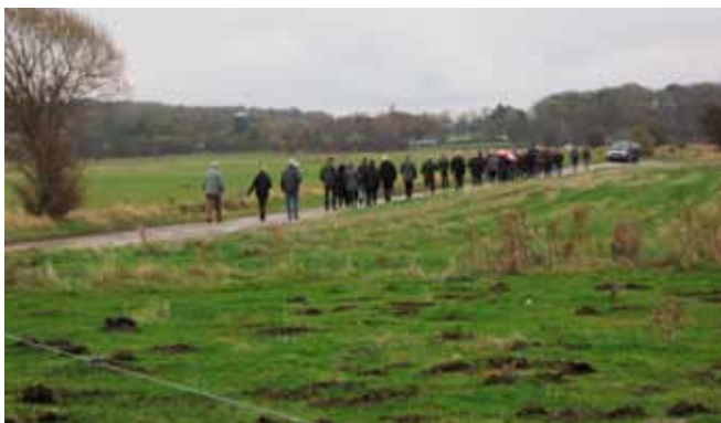
Indvielsen af projektet LIFE – Helnæs.