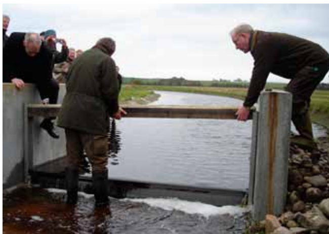
Oplægning af ”svineryg”.