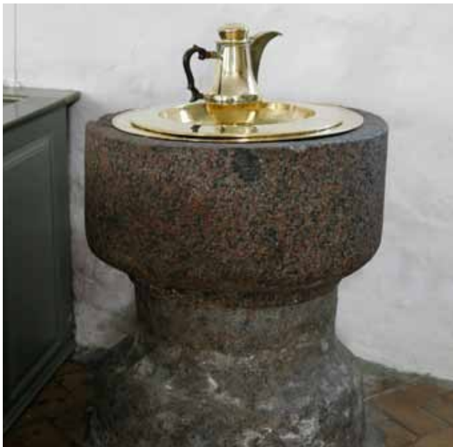
Nuværende døbefont.