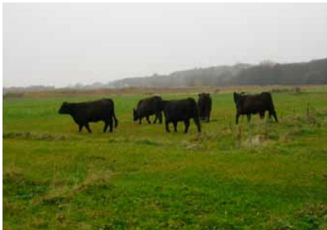
Galloway dyrene lukkes ud på Maden.

Vi er nu i gang med at justere vandstandshævningen i den sydlige del af Maden endelig på plads ved brug af pumpen og de 2 nye stemmeværker. Vandstanden har i nogle områder været lidt højere end beregnet, men vi forventer, at de sidste justeringer falder på plads snarest. I løbet af vinterperioden skal vi have heget de nye arealer i den sydlige del af Maden og i Bobakkerne, så arealerne er klar til afgræsning til foråret. Herudover vil eksisterende