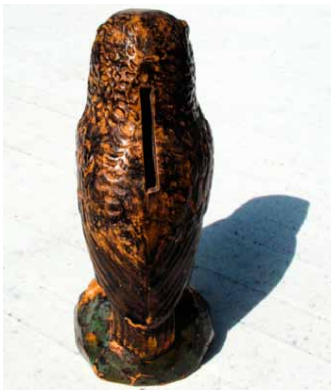
Uglen som sparebøsse bemærk revnen i ryggen Produceret på Elmebjerg teglværk

Der er delte meninger, om der overhovedet har været et teglværk på Elmebjerg. Nogle mener endda, at det er en myte, at der var et teglværk på Elmebjerg, og at det styrtede i havet under stormfloden 1872. Ingen steder har det været nævnt, at noget sådant er sket. Indtrykket efter 1872 er, at alle skader blev refereret i dagspressen eller i oversigter over tab, men teglværket er ikke set at figurere i sådanne oversigter eller opgørelser. Ved at stykke forskellige oplysninger sammen, kan det dog med meget stor sandsynlighed slås fast, at der har været et teglværk. Elmebjerg er en bakke og en klint på bagsiden af Bobakkerne ud mod Helnæs Bugt, nord for Rørmosen. Placeringen af teglværket her skyldes, at der har været ler og sand lige til at grave op og bruge i produktionen, desuden har placeringen været praktisk, idet der i den tidsperiode