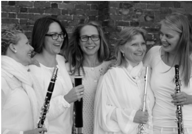
Kvintetten - Qvindetta

En kvintet bestående af 5 kvinder – qvindetta – sørger for, at vi kommer i julestemning i år.