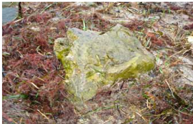
Sammenbrændte mursten på stranden.