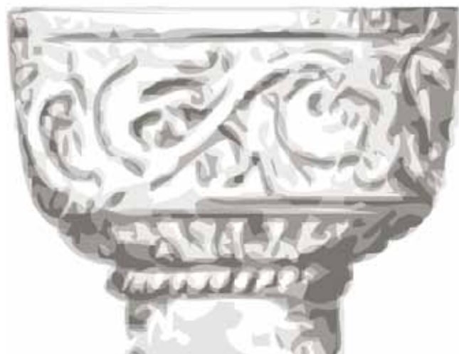
Grafik af gl. døbefont.

Genstanden for denne historie er en romansk døbefont af