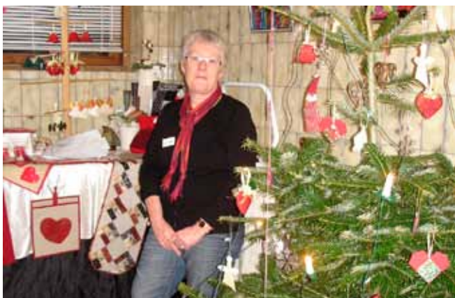
Quiltepigens Randi passer butikken på Strandbakken. Tilfreds med omsætning.