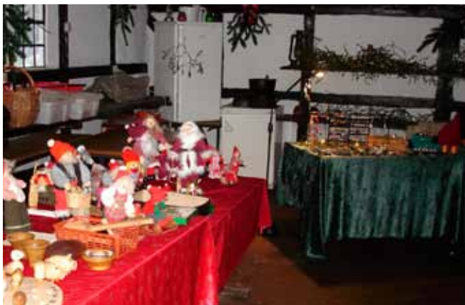
I laden alt i julepynt, trædrejede gaver. Gedegrillpølser m.m.