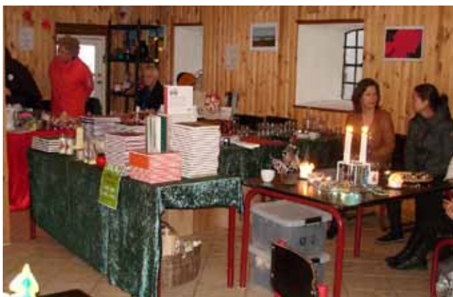
I stalden bøger fra Odense Bys Museer, Tombola fra Folkekirkens Nødhjælp m.m.