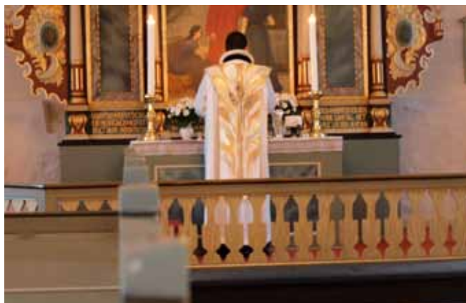
Messehagel i brug under højmesse.