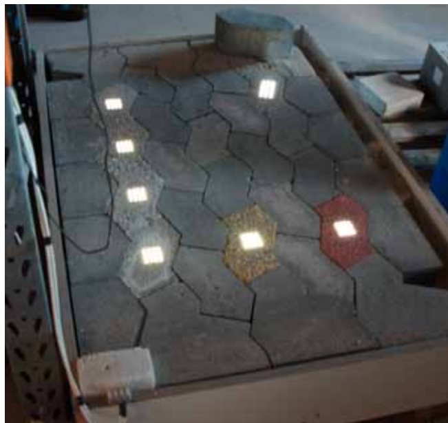
Demonstration af funktionen. Lys i betonflise.

Udviklingen er vendt i forhold til at bo i udkantsområder, men politikerne arbejder for at samle alt i større enheder og medierne synes tilsyneladende ikke det er en god historie at fortælle om denne positive udvikling. Der er desværre også visse ulemper ved at etablere sig på Helnæs. Logistisk