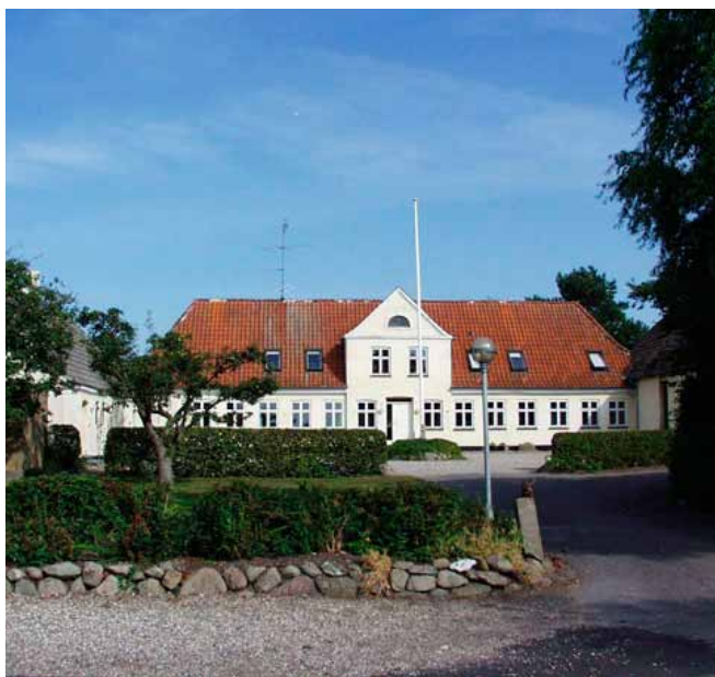
Højskolen på Helnæs.