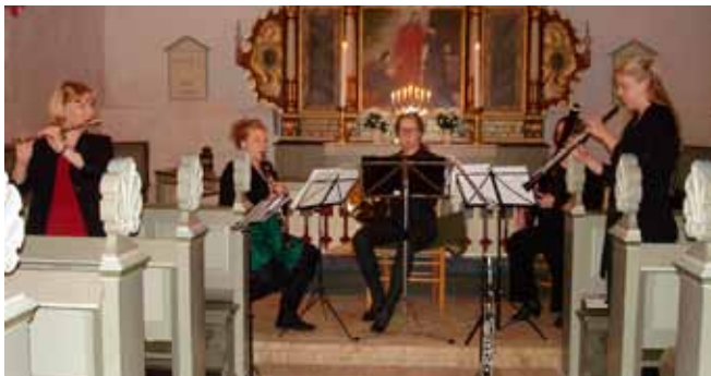
Quindetta i Helnæs Kirke.