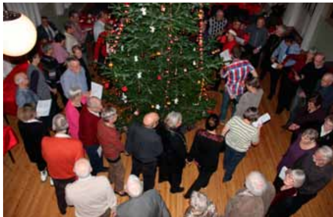
Dans omkring juletræet.