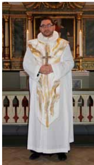
Præsentation af messehagel.