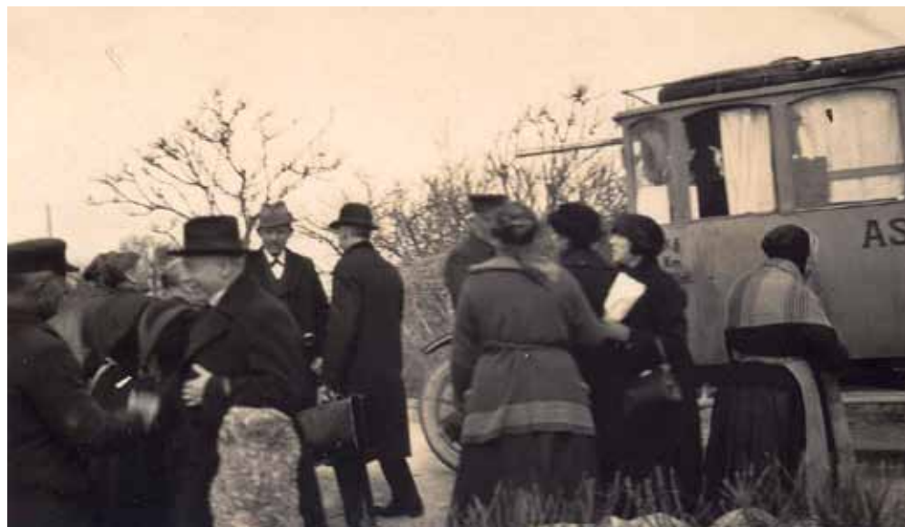
Afgang fra Helnæs med Assens – Helnæs bussen