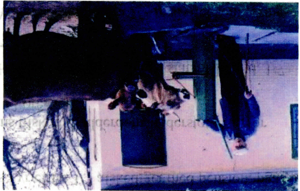
Søren Sørensen Strand- bakken 5, vandrer sine køer ved Strandbakken 3