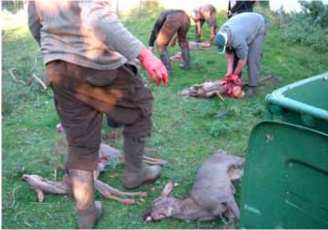
Dyrene brækkes op blodet samles op.

På jagtdagen mødte interesserede jægere og klappere på Østergård kl. 9, hvor numrene blev uddelt og posterne fordelt. Formiddagen begyndte med en lille regnbyge, resten af dagen var der flot solskinsvejr og lunt, da Helnæs jagtforening traditionen tro afholdt den årlige dyrejagt den 10. oktober. Der var knapt så mange deltagere i jagten, som der plejer. Der var 26 skytter og 21 klappere. Klapperne sørgede for at dyrene kom frem af gemmerne. Jægerne skød 9 rådyr, deraf var kun én buk med opsats. Da dyrene blev kørt