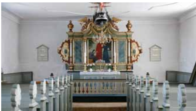
Alteret i Helnæs Kirke.