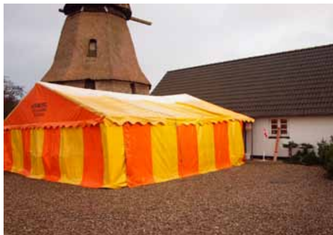
Teltet som ikke sættes op i år.