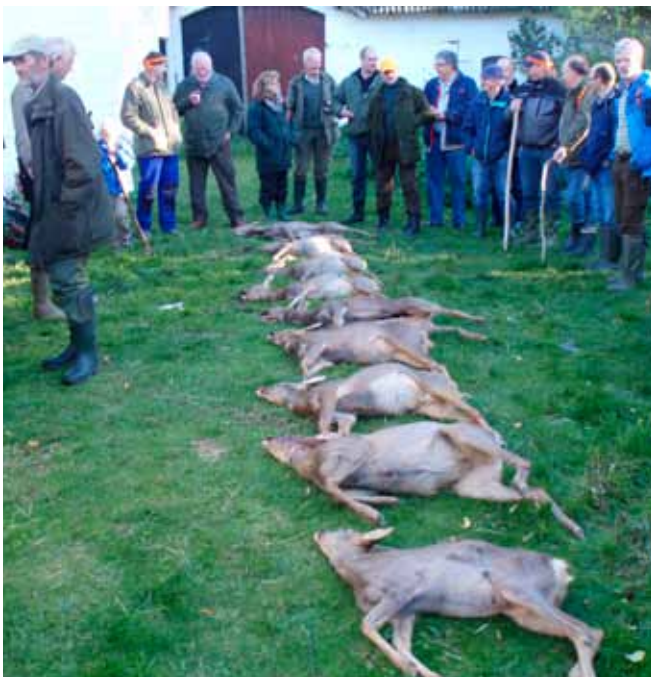
Vildtparaden med jægere og klappere.