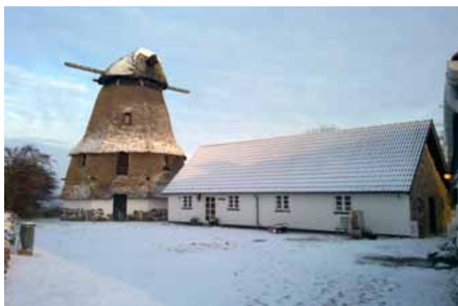
Møllen i sne. December 2010.