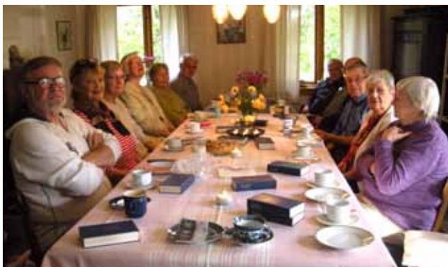
Torsdagsklubben ved kaffebordet hos Ellen 'Nørregård'.

På opfordring vil jeg skrive lidt om Torsdagklubben. Gennem en årrække havde ældre mennesker fra Helnæs taget rutebilen til Ebberup tirsdag eftermiddag til kaffe,