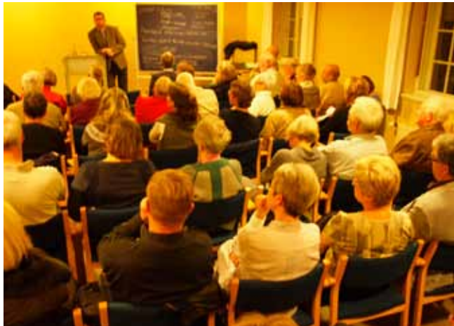
Formanden byder velkommen

Formanden for Højskolen, ALR, bød velkommen og