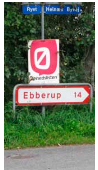
Valgplakat liste Ø

Ser vi på, hvem vi ligner, så må det erkendes, at både Assens og Fyn er betydeligt mere socialdemokratiske end Helnæs og resten af landet i gns. Det har vi så fået en fynsk landdistriktsminister på. Den sammenhæng skal ikke underkendes. Vi er ikke meget radikale på Helnæs, det har aldrig slået an herude. Det kunne tænkes at skyldes vort vejnet. Vi kommer sjældent i tvivl om hvilken vej, vi skal. Det gør de radikale heller ikke, men der er mange, der mener, at de ofte står ved en korsvej, og så skal man jo overveje, om det dej'n vej eller do'n vej, man skal. Man kan også se, at B-stemmerne hentes andre steder end på Fyn. Tager vi nu rød blok under et, så er Assens Kommune rød i samme omfang