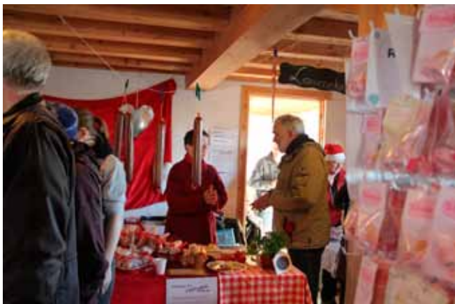
Julemarked på Møllen 2010