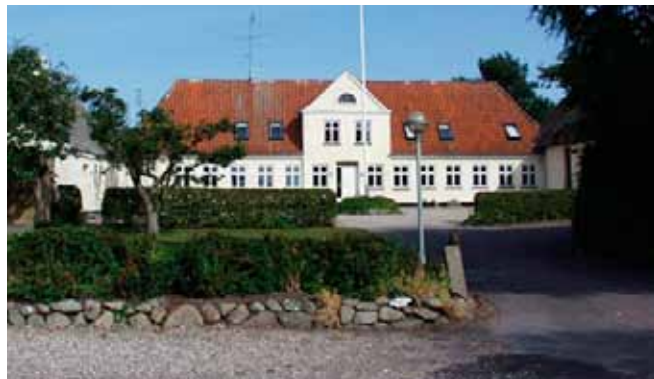
Højskolen på Helnæs

Industrivej 2-4, Nr Broby, 5672 Broby. 62632930