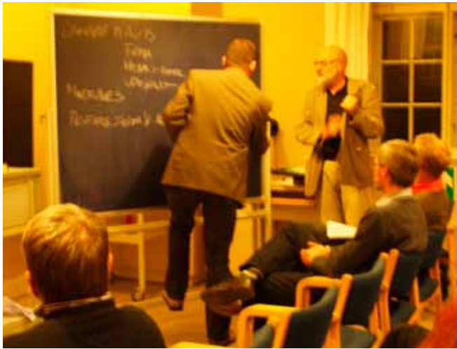
Idéer noteres på tavlen

finde en person, der vil stille sig i spidsen for redningsarbejdet og evt. påtage sig forstanderjobbet på sigt. Skal operationen lykkes, skal der arbejdes hurtigt og effektivt.