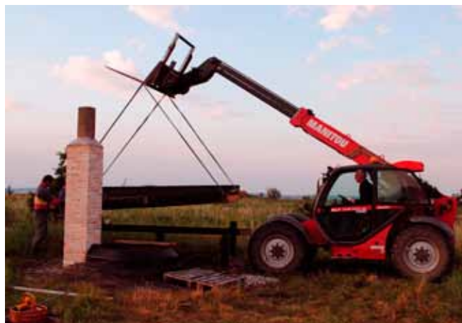
Rampe løftes på plads

Der drives ikke længere erhvervsfiskeri fra stranden her på Helnæs. Endnu kan