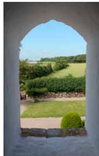
Udsigt gennem tårnluge mod nord.

flere lister med kandidater til Pia Haahr eller Elsebeth Holk, som begge er med i valgudvalget, er ovenstående liste gyldig og menighedsrådet er valgt for de næste fire år.