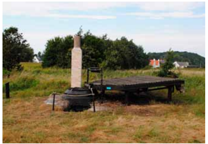
Den færdige restaurering