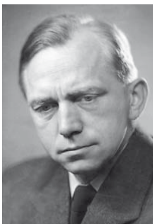
Forfatter Martin A. Hansen