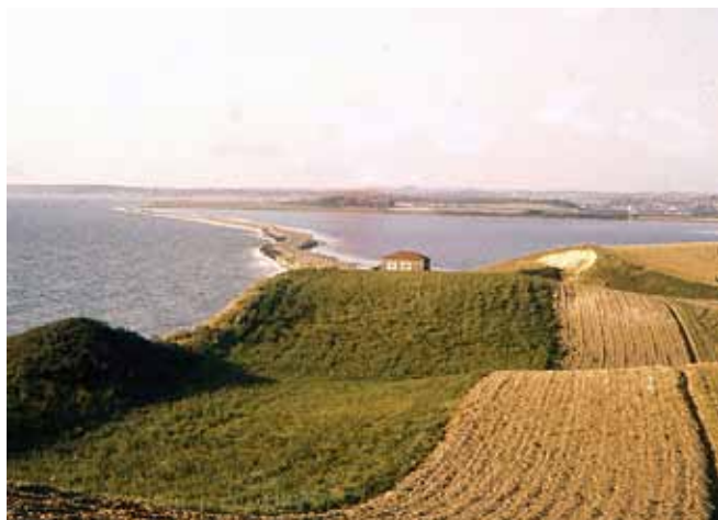
Bobakkerne med hus