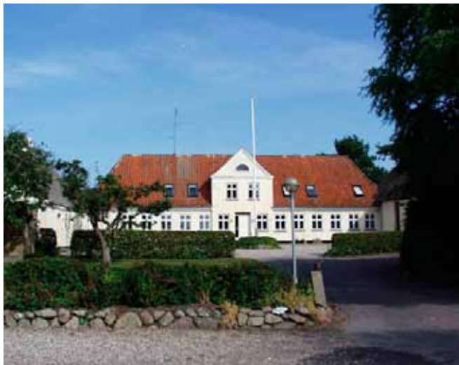
Højskolen på Helnæs