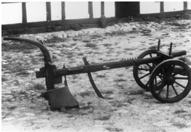
Hjulplov afløstes af svingploven i ca. 1830

Nu voldte det sikkert ikke det store problem på Helnæs, idet man må antage, at der kun var én "stamme", den samme, som hele tiden har været der, men som gradvist blev større ved tilflytning. Historielitteraturen fortæller os, at der i dette århundrede, (1100) skete en voldsom udvikling overalt. Befolkningstallet gik op, vikingernes internationale eventyr var forbi og alle ressourcer blev vendt indad til etablering af landsbyer (adelbyer og torper), med eller uden kirker. Kristendommen og udviklingen af stormands- og kongedømmet skabte store værdier i landet. Med klostre og kirker fæg meget nyt over hegnet, bl.a. blev klostrene, med deres viden og evne til at kommunikere med folk fra andre lande, den tids landbrugsskoler, hvor mange nyheder og gode råd udgik fra. Øer og kyster blev gradvist befolket, og ofte blev befolkningstætheden på øerne større end på fastlandet. Sandsynligvis skyldes det kombinationen af