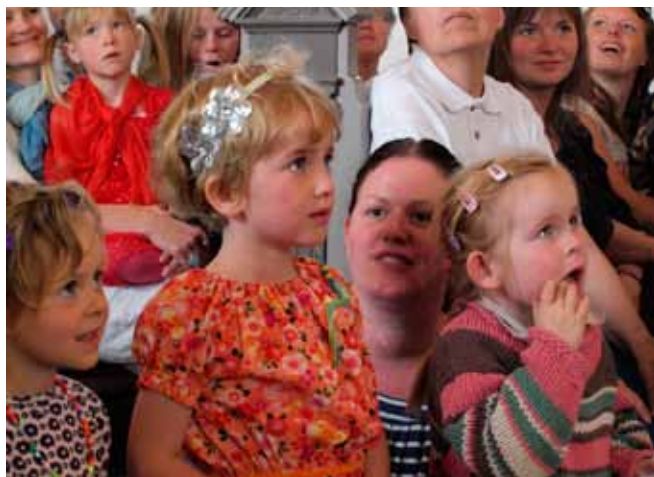
Ungt publikum til kirkekoncert, arkiv

Det er svært at sige. Det bedste vil være, at interesserede kan gå ind på vores hjemmeside www.helnæskultur.dk , skrive sin mailadresse, så får man automatisk tilsendt nyhedsbrevet.