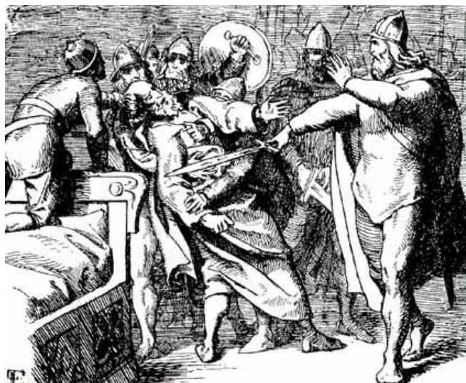
Den kullede greve Gert dræbes i Randers 1340

På dette grundlag må vi antage, at bønderne har opgivet deres selvejerstatus og er blevet fæstebønder. En udvikling, der gradvis sker over hele landet. Det antages, at kun 5 % af alle bønder var selvejere omkring enevældens indførelse 1660. Årsagerne hertil kan være mange, generelt har man fundet, at det at være selvejerbonde og skulle administrere sine mange skattebetalinger, tiende, ledingsskat o.m.a. var problematisk. Konjunktursvingninger og voldsomme klimaskift medførte store variationer med overskud et år og misvækst et andet. I 1300-tallet opstod en sådan situation, der desuden fulgtes af "den sorte død", pesten, som slog tusinder ihjel, og lagde hele landsbyer øde. Ændringer af magtforholdene mellem kirke og konge efter reformationen, hvor klostrene og ikke mindst bispesæderne afleverede så meget jord til kronen, at krongodset blev doblet op, gav også ændrede vilkår. Herremændene