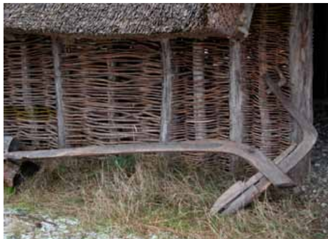
Ard. Oldtidens plov indtil 1100

Bønderne dyrkede jorden med en ard, dvs. en pind i jorden, trukket af en okse, der nok kunne ødelægge rødder af uønskede planter, men den vendte ikke jorden. Ikke desto mindre havde man på den tid fremavlet de fire almindeligt kendte kornsorter, rug, hvede, byg og havre samt holdt køer, heste, svin og får på stald. Fra begyndelsen af den tid, vi ser på, skete et teknologisk spring fremad med indførelsen af hjulploven, trukket af heste, og gennemførelsen af vangebruget, som skabte grundlaget for en anden måde at producere fødevarer på. Begge disse nykabelser er forudsætningen for, at der kunne etableres en landsby, dvs. et fast sted at bo. Samtidig var et tæt, nødvendigt fællesskab om arbejdet en forudsætning for,