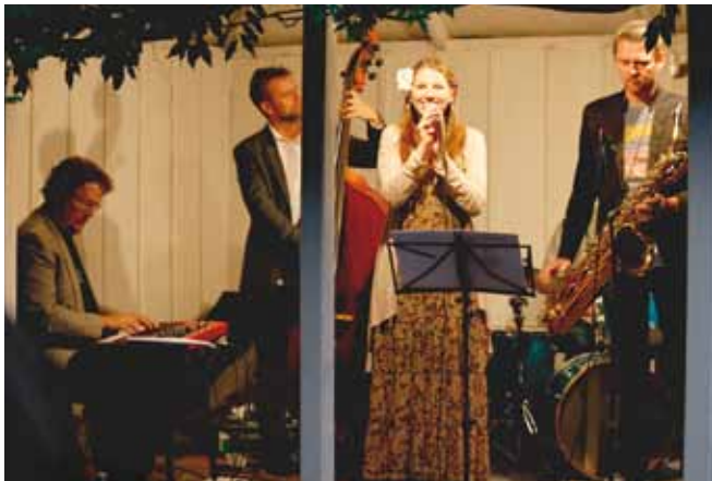
Orkestret i pavillonen