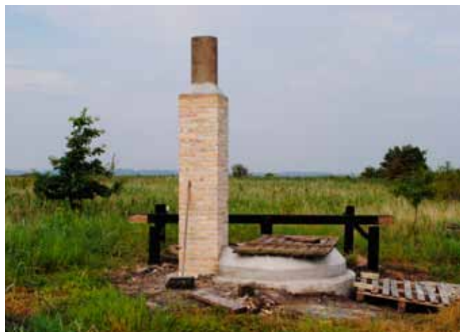
Tjæregryden på Odden