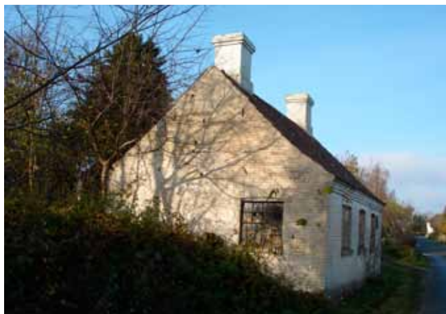
Den gamle smedie holder endnu