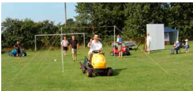
Ringridning på havetraktor