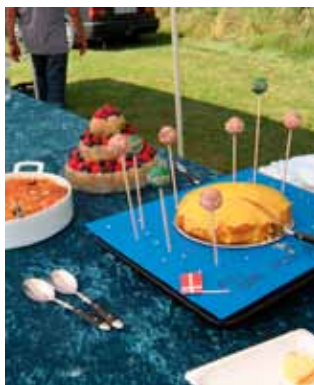
Kager til bedømmelse