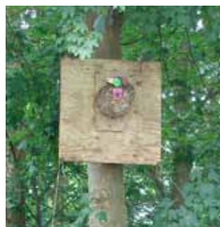
Fuglen i træet