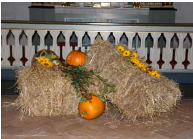
Fra høstgudstjenesten 2011