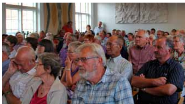
Højskolens foredragssal er mere end fyldt op