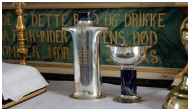
Alteret Helnæs Kirke

HVAD SKAL VI STILLE OP MED DE TOMME KIRKER? 73,2% mener det er i orden at lukke dem. Hvad mener du? I en landsundersøgelse mener 3 ud af 4 danskere, at det