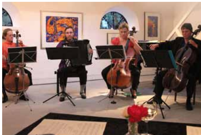
Four Funen Females