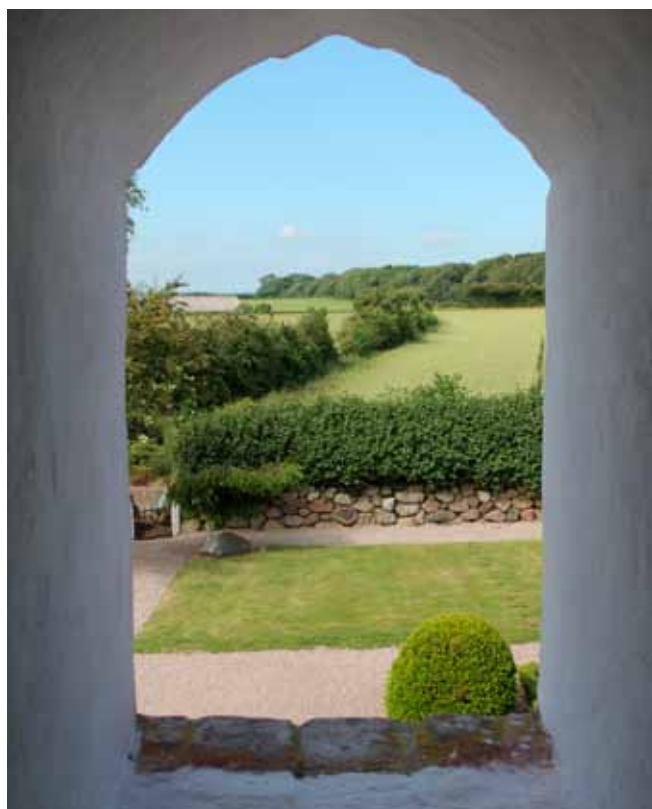
Udkig gennem tårnluge

Undervejs har kapellet skiftet udseende og er blevet til