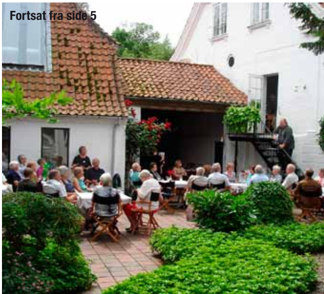
Per Lyder Dahle byder stort publikum velkommen