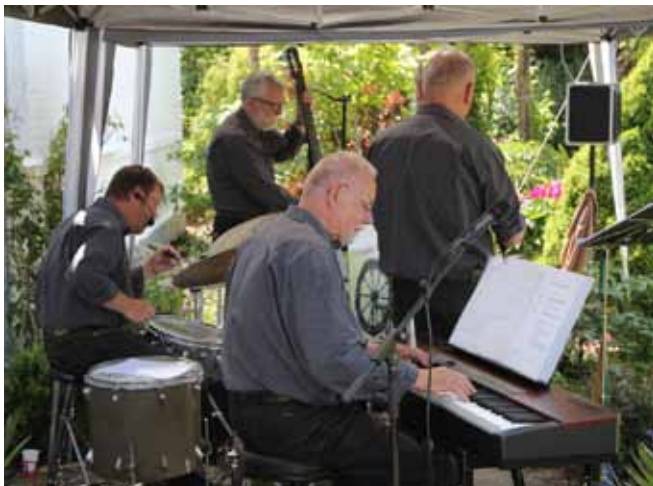
Spinning Wheel i tørvejr