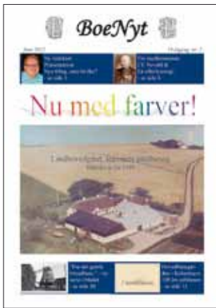
Boe-Nyt – forsiden af Boe-samfundets blad