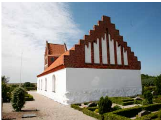
Kirken set fra øst mod vest