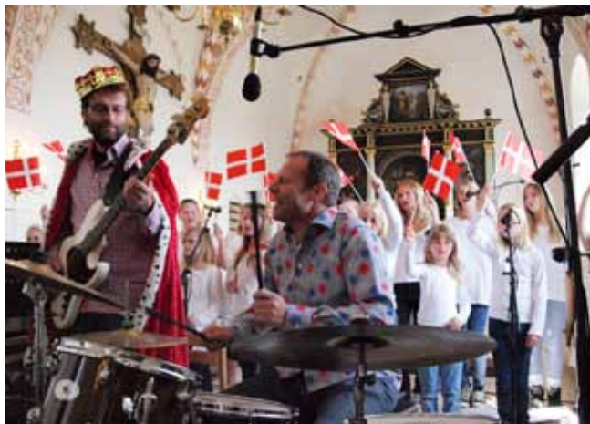
Hyldest til Kong Salomon

Som forventet mødte rigtig mange mennesker op (og en hel del billetter var da også solgt i forsalg), så menighedsrådene og musikforeningen havde allieret sig med Hjemmeværnet,