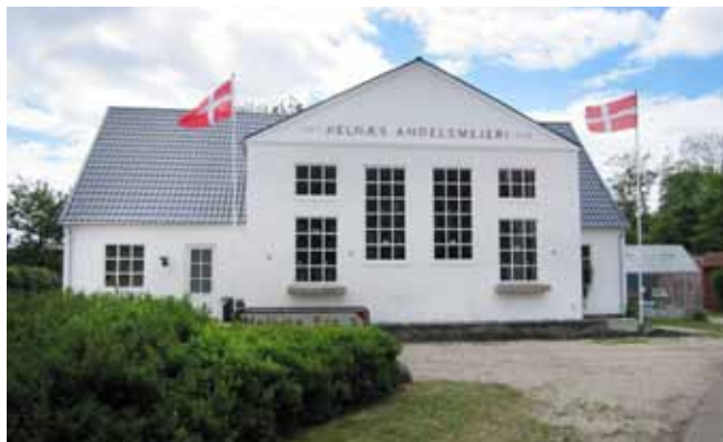
En ny tid venter

Så snart mælkevognen ankommer til mejeriet, bliver mælken fra hver enkelt leverandør hældt op i vejekarret og vejjet. Der udtages daglig prøver for at se, hvor stor en fedtprocent mælken indeholder. En gang om ugen udtages en prøve, hvorved mælkens holdbarhed konstateres. Man tilsætter mælken et farvestof, og for at komme i første klasse skal mælken holde farven i 5½ time, hvorimod dårlig mælk næsten affarves med det samme. Når mælken er vejjet, og vægten noteret, og prøverne er taget, lukkes mælken over