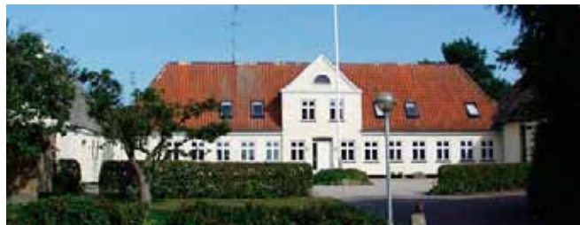
Højskolen på Helnæs

indledte med at sige, at hans indgang til forstanderjobbet var at tænke på arbejdet med udtryk som ’min højskole’ og ’vores højskole’. Det nye