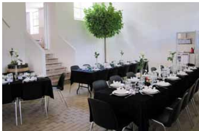
Selskabslokale med træ

Helnæs Andelsmejeri er kun et lille mejeri, idet der kun findes 53 andelshavere, som daglig leverer ca. 5.000 kg. mælk. Men virksomheden har alligevel haft en stor betydning og i 1937 blev det nødvendigt at udvide og modernisere mejeriet. Der blev bygget kølerum med moderne frysemaskine og opstillet ostekar og en ny og bedre centrifuge. Hele denne modernisering kostede ca. 80.000 kr."