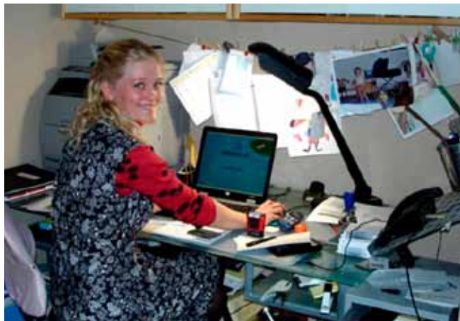
Da det hele begyndte