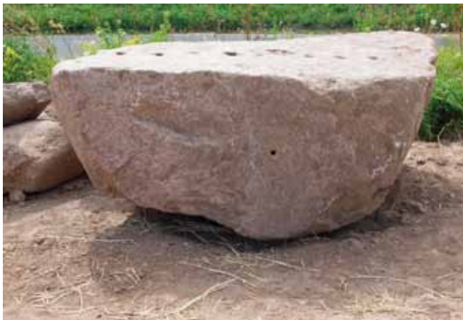
Sten med flækkemærker og krudthul

I 1700 tallet fik danske bønder adgang til at sprænge sten med sortekrudt. Med hammer og mejsel slagborede man et 20 – 30 cm dybt hul i stenen. Hullet blev fyldt med krudt og lunte. Den blev antændt, og så var det bare at søge dækning og holde sig for ørene. Gik det godt,