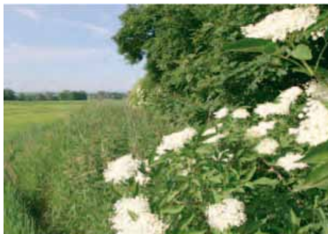
Hegn med hyld

Her er opskriften, hvis du har lyst til at forsøge dig som vinproducent: 30 store skærme hyldeblomster