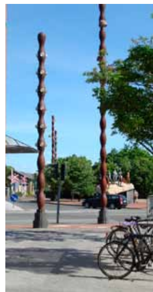
Cobrainspirerede lygter (Bjørn Nørgård)

De energimæssige krav til den tid, vil betyde et loft over energiforbruget pr. m 2 på maksimalt 50 kwh/m 2 pr. år. Dette mål skulle nås uden yderligere brug af isoleringsmaterialer etc. Kun ved at investere i vedvarende energiformer, anvende elektroniske styringer etc. Der blev til