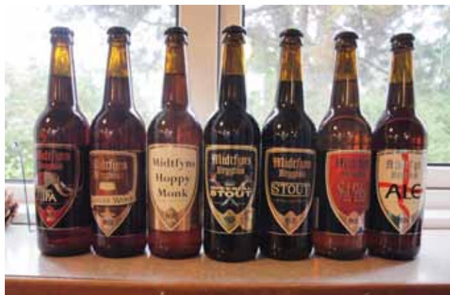
Udvalg af bryghusets øl