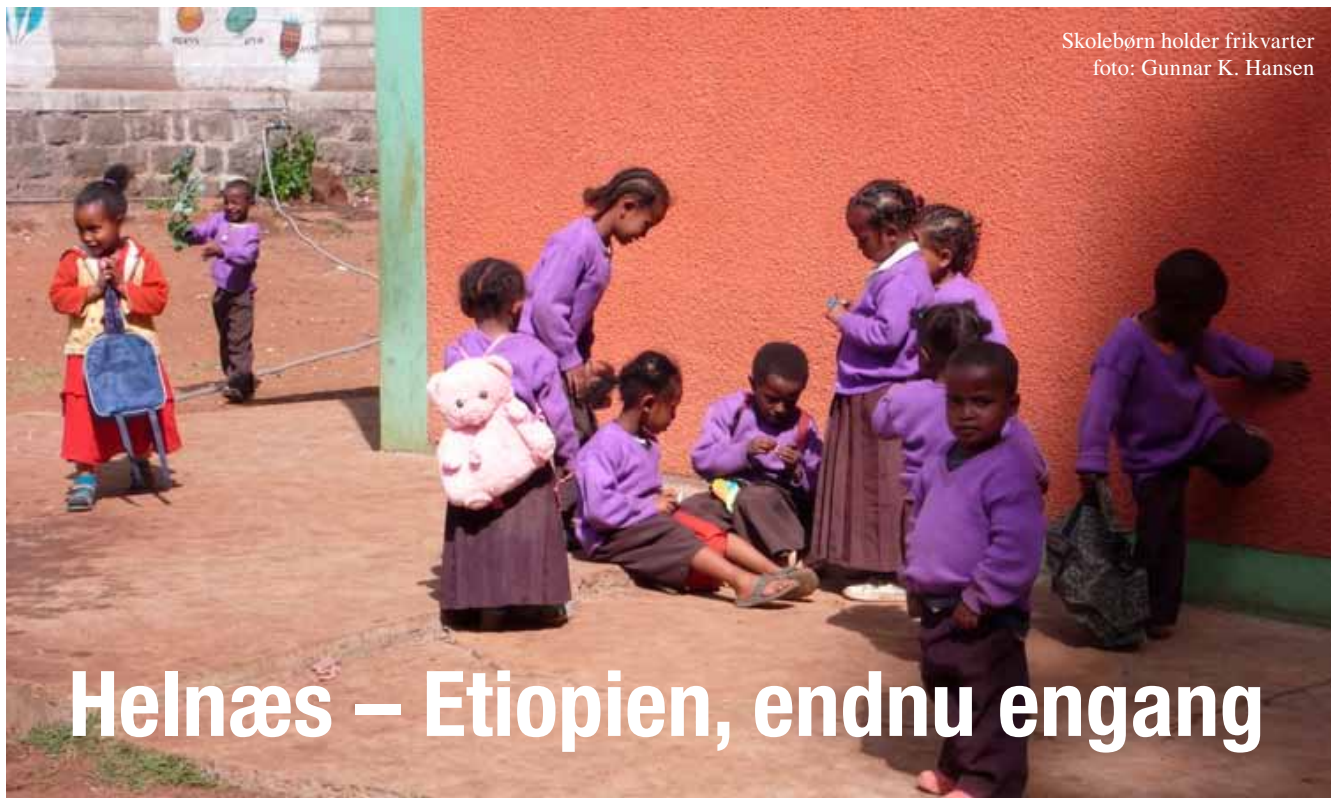
Skolebørn holder frikvarter

Helnæs Kirke Supplerende nummertavler – Se side 5