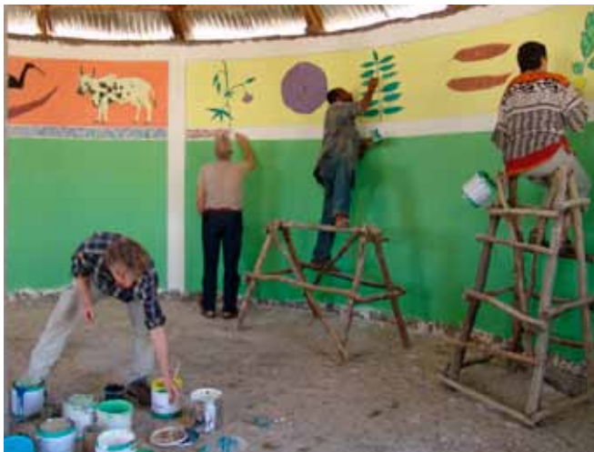
Kunstnerne dekorerer skolen