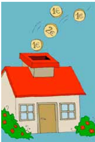
Der fyres for fuglene.

Der er stor interesse for koncerten, hvorfor forhåndstilslutning er nødvendig. (tlf. 61 73 45 40). Dørene til kirken åbnes en time før koncerten begynder. Der er ikke nummererede pladser. (Se annonce side 11) pd