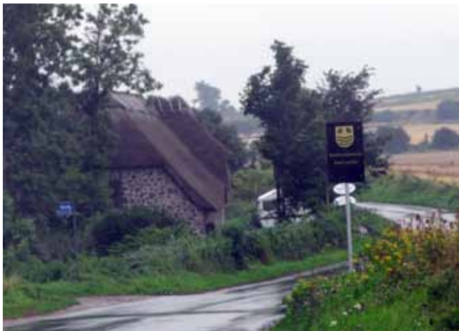
Vejen ved Bogården