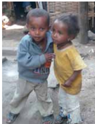
Det er dem fremtiden handler om.