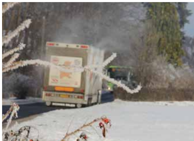
Bus og lastvogn mødes. Behov for vigespor? Kan ikke passere. Bus må bakke til forsamlingshus.

Den helt store udfordring til vejnettet kommer i denne periode, idet biltrafikken overtager skibstrafikken. Herefter køres alt gods til og fra Helnæs over Langør. Samfundet ændrer sig meget lidt indtil efter 1950, hvor landbruget gradvist mekaniseres, affolkningen tager fart, storkommunen dannes (1966), mejeriet lukkes (1973) og den nye vej anlægges til et område med plads til 140 nye sommerhuse. Anlagt ud fra en forestilling om, at det vil skabe en omsætning, så den eneste købmand / brugs kunne bevares til nytte/glæde for helnæsboerne. De er i mellemtiden blevet så godt motoriserede, at de handler hos discount-