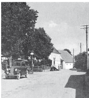
Stævnevej med bil 1940

Lad os afslutte dette emne med en relativ kort afrunding