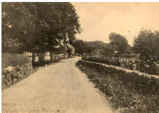
Gadeparti med stengærder

Claus Bjørn (red.) Det danske landbrugs historie, Bind 2-3, 1988 m.fl.