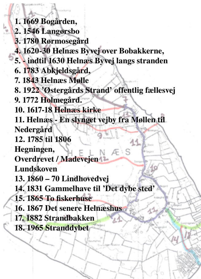
Helnæs Kort 2011. Vejene på Helnæs.

Det er givet, det har været meget besværligt at køre med vogn og hest / okse, idet det må formodes, at der i de tidligste tider kun har været hjulspor i terrænet at følge. Vejrliget kunne skabe plørede og ufremkommelige hjulspor. Det 'organiserede' landbrug omkring landsbyen havde behov for hegn langs vejen, idet den daglige kvægdrift ud og hjem nødvendiggjorde at hindre køer og andre dyr at ødelægge afgrøder på de tilstødende marker. Bl.a. stammer udtrykket 'at opgave ævred' fra jordfællesskabets tid og blev brugt, når man fjernede hegnene