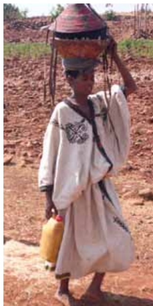
Etiopisk kvinde henter vand

geri i Addis Ababa gennem foreningen "viden for alle". Foreningen bygger og renoverer skoler for penge, der især er indkommet ved auktion over billeder, skænket af danske kunstnere, herunder undertegnede. Seneste auktion var her i foråret på "Kunsten" i Ålborg og indbragte ca. 800.000 kr., som går ubeskåret til fortsatte skolebyggerier.