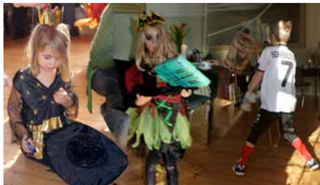
Der foregik meget spændende under festen

Helnæs Forsamlingshus var befolket af flotte udklædningsbørn, da bestyrelsen arrangerede fastelavnsfest for børn og voksne den 19. februar. Der blev slået katten af tønden. Katten var heldigvis kun af papir. Den store tønde var hurtigt slået til plukfisk, mens den lille var noget drøj at få has på. Aldersgrænsen for stor og lille tønde var 7 år. Selv-