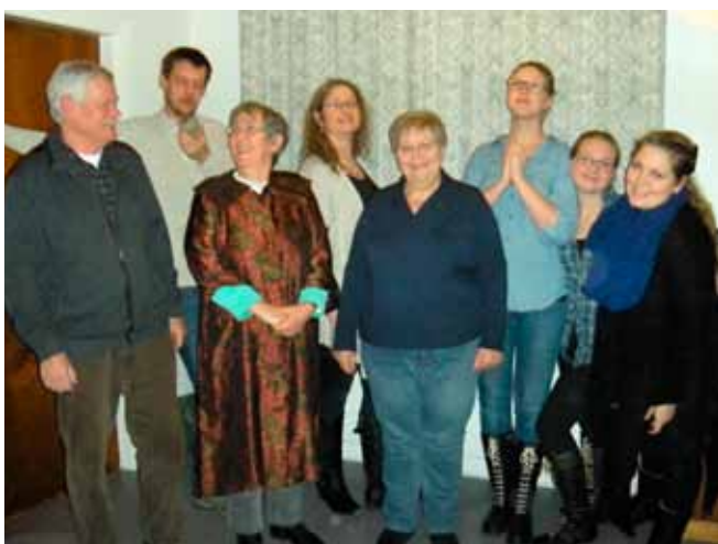
Dilettantholdet 2012 samlet efter prøve