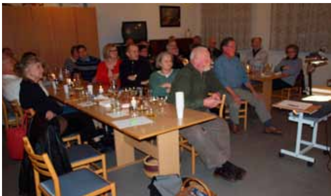
Stort fremmøde ved første vinaften