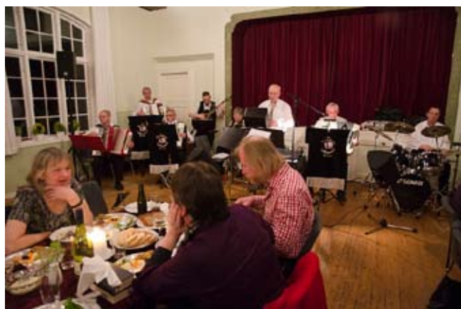
De Thorøhusespillemande ved Vinterfesten

Ingen kan vel benægte, at vinteren kom tidligt – og at den næppe heller er overstået endnu. Derfor var det uhyre velvalgt at navngive festen 29. januar i forsamlingshuset efter årstiden. Aftenen var kommet i stand i samarbejde mellem forsamlingshuset og musikforeningen (der således startede sin nye sæson historisk tidligt). Og der var stuvende fuldt – såvel Helnæsboere som fastlændinge fyldte huset til sidste plads. Arrangementer med kniv og