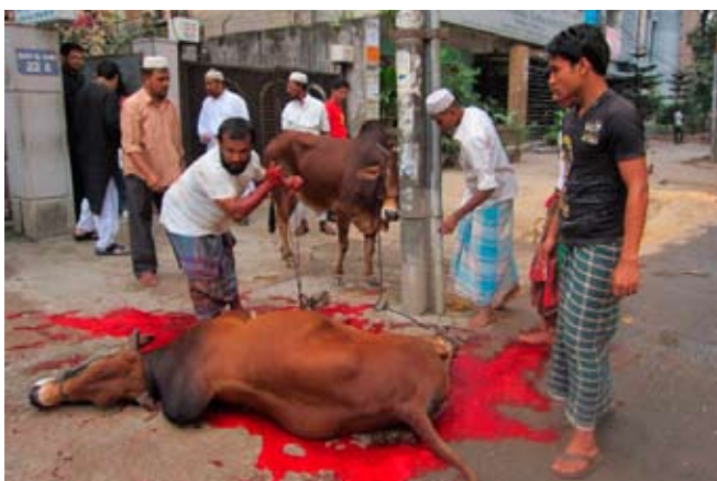
Kvægslagtning på gaden

Ved siden af skoleaktiviteterne tilbyder højskolen vaccination af husdyr (kreatur og høns), vejledning i dyrkning af afgrøder etc. En tidlig morgen deltog jeg i et vaccinationsprogram i en landsby, hvor kvinderne kom vandrende til stedet med deres høns og kyllinger