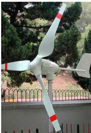
Vindmølle til havebrug