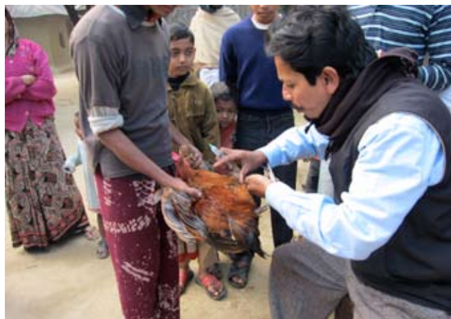
Vaccination af høne

fælles sparekasse og der er ca. 1.000 der, af disse opsparede midler, modtager mikrolån til køb af husdyr, symaskine, værktøj etc. – til forbedring af den økonomiske virkelighed. Alle disse initiativer skal nu forsøges bundet sammen til en fælles enhed i forbindelse med højskolens overordnede vision om en bedring af den fattige landbefolknings levevilkår. Organiseringen har fået betegnelsen MAPP (member association PP) Jeg havde møder med landsbyernes ældsteråd – mændene – for at forklare sammenhængene og for ikke at få dem imod projektet – i dette mandsdominerede og konservative samfund. Jeg havde møder med borgmester og politikere for også her at gøde jorden og forklare sammenhængerne. Det er jo interessant som dansker, med indgroet afsky for korruption, at møde politiske og administrative niveauer, hvor korruption er en selvfølge. Højskolens folkelige bagland og de aktiviteter, der udspringer heraf, er dog så synlige, at korruptionen kan holdes borte. Det er med stolthed vi fra Højskoleforeningen i Danmark