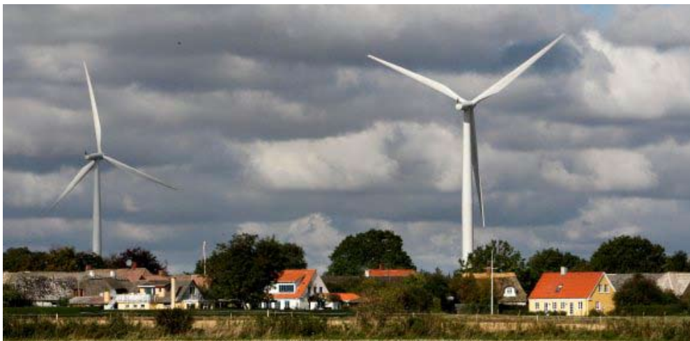
Vindmølle under truende skyer

står bl.a., at foreningen skal arbejde for, at Helnæs bliver CO 2 -neutralt og at Helnæs kan blive energimæssigt selvforsynende med vedvarende energiformer.