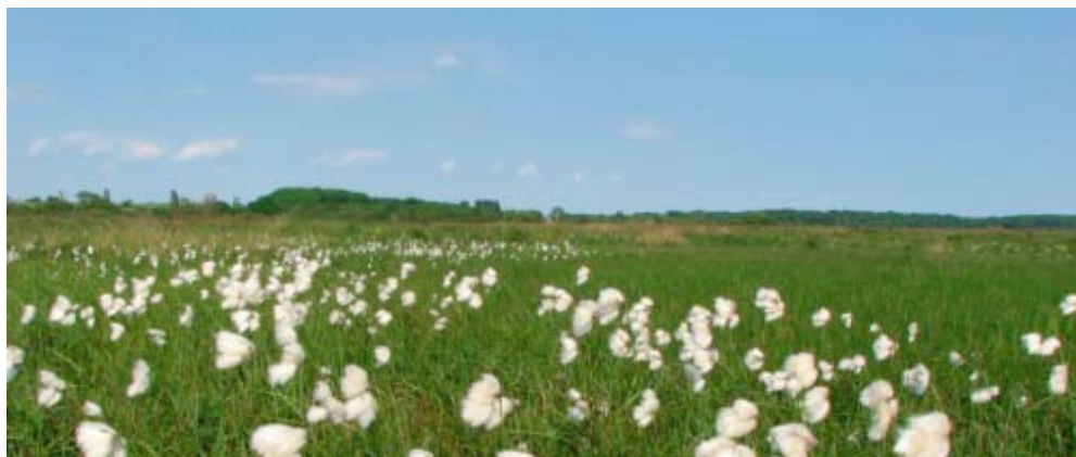
Helnæs Made. Smalbladet kæruld