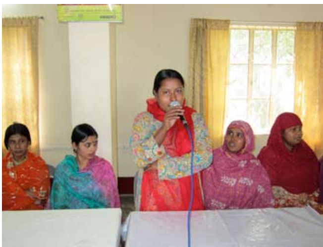
Her siges: 'I har tændt en drøm'

at fastholde aktiviteterne i landsbyernes kvindegrupper – også efter ophøret af dansk støtte. En efter en rejste disse kvinder sig op, iført deres sari og med tildækket hår, gav de mundtligt udtryk for, at de aktiviteter som højskolen, i de 22 år der er gået, havde været afgørende for udvikling i de berørte landsbyer. At kvinderne havde fået mulighed for at få viden og indsigt, få viden om menneskerettigheder, få viden om det farlige ved at bortgifte døtre i alt for ung alder, få viden om sundhed, hygiejne og landbrug. – Det var et bevægende øjeblik, da den ældste kvinde rejste sig og sagde: "Vi har fået tændt en drøm, nu kan vi selv. Jeg ville ønske at denne mulighed havde været der, da jeg var ung." Da fik folkeoplysning mening for mig fordi dette var forskel på at leve i lyset eller i et formørket middelalder-menneskesyn. Som Grundtvig skriver – "Er lyset for de lærde blot til ret og galt at stave, nej himlen under flere godt, og lys er himlens gave...." Dette menneskesyn bør muslimere og kristne kunne blive enige om, hvis vi vil udfordre den globale udvikling.