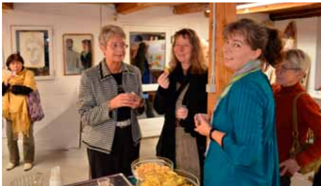
Højt humør ved baren