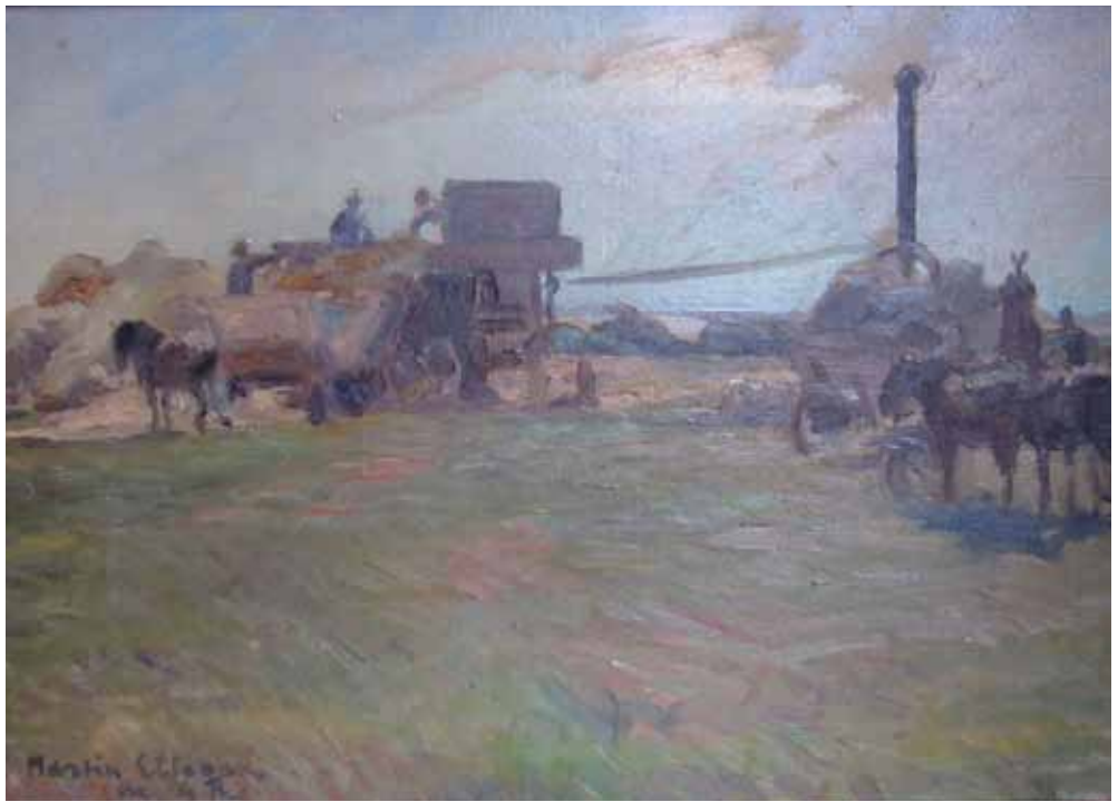
Tærskning med lokomobil 1916

Vi ved, at parret i en (ferie) periode har boet på Helnæshus, medens der endnu var