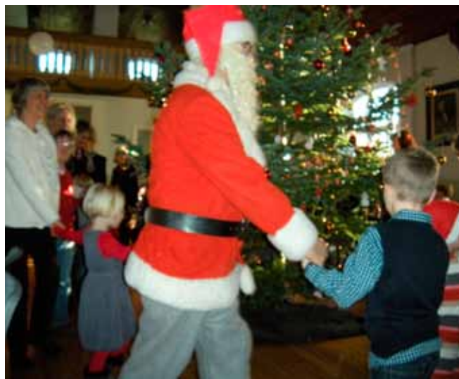
Dans om juletræet

En fin eftermiddag og en god tradition. ah