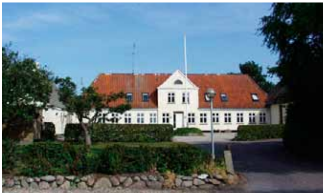
Højskolen på Helnæs

I forlængelse af indsamlingen blandt beboerne på Helnæs til intensivering af Helnæs Højskoles markedsføring, som indbragte over 22.000 kr., har vi modtaget en yderligere støtte til dette formål fra Jeppe Kehlet's Fond på 15.000 kr. På vegne af Helnæs Højskole's venner, bestyrelse og ansatte vil vi gerne sige mange tak for den store støtte og opbakning til skolen. Jeg kan på skolens vegne love at pengene vil blive brugt til, så ef-