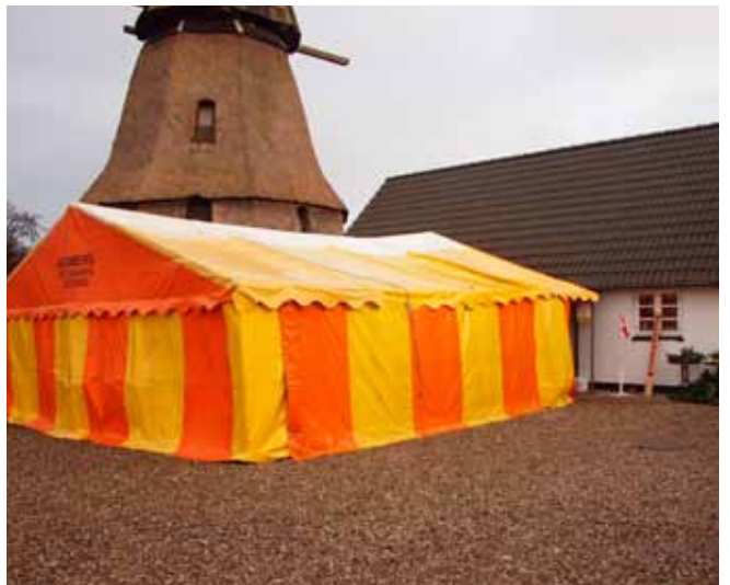
Teltet på Møllen