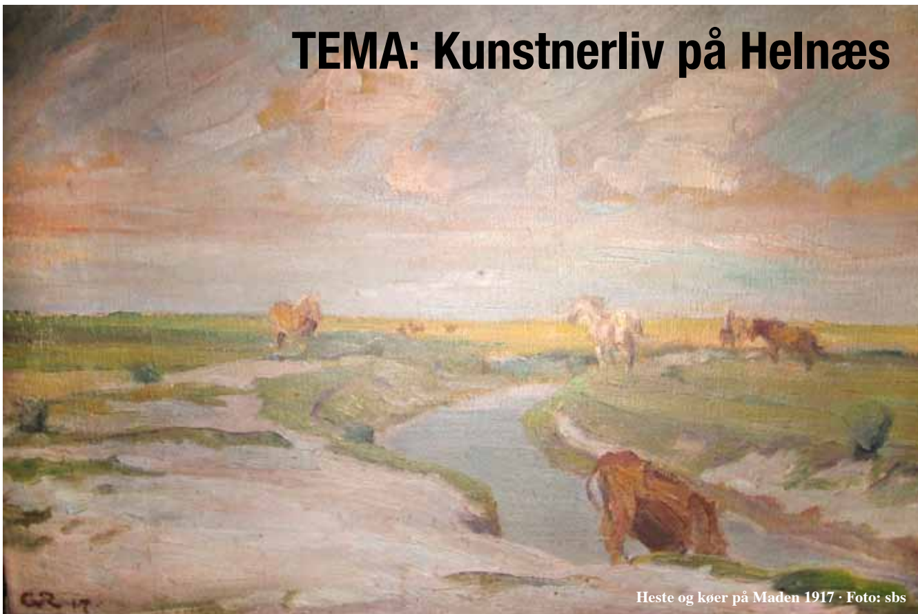
Heste og køer på Maden 1917