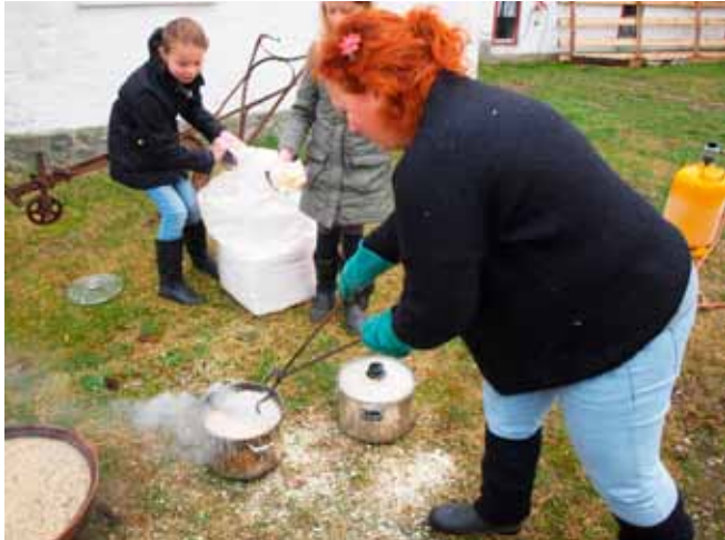
Mejeriet. Rakubrænding var meget populært

pigerne i koret var lidt trætte af at blive overklappet af akkompagnementet skjulte de det rigtig godt, og koncertens fineste øjeblik for mig var en chase – en slags musikalsk legen kispus – mellem koret og pianisten i ét af de sidste stykker. Der synes i øvrigt at være mange meninger omkring klapperi under korkoncert, og som en service til næste års koncertgængere (herunder undertegnede) kon-