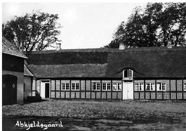
Abkjeldsgård efter udflytning

Tre af de gårde, der senere bliver flyttet ud, har oprindeligt ligget midt i Helnæs By. Det er Stormgården, den