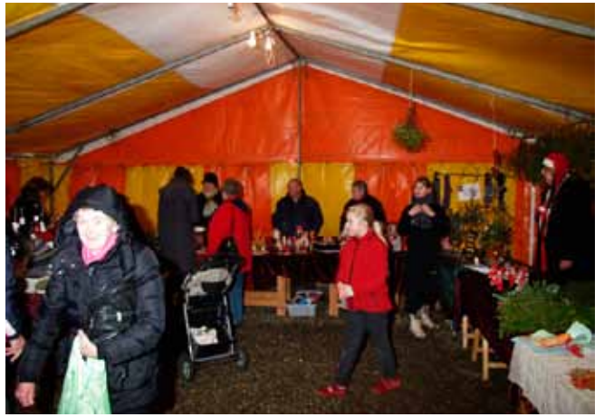
I teltet var der mange udsalg