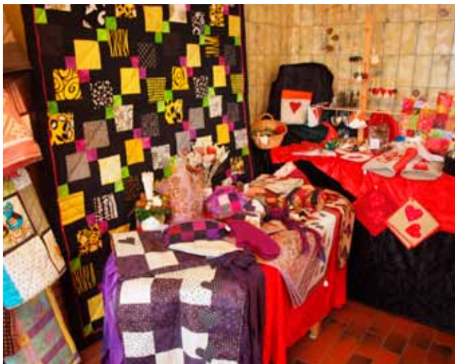
Quiltepigernes farverige udstilling