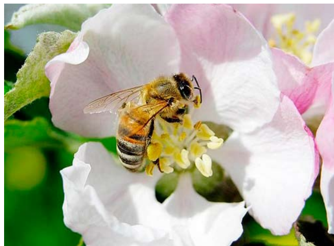
Bi i blomst