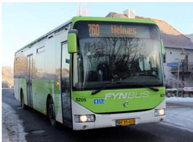
Den nye Helnæsbus