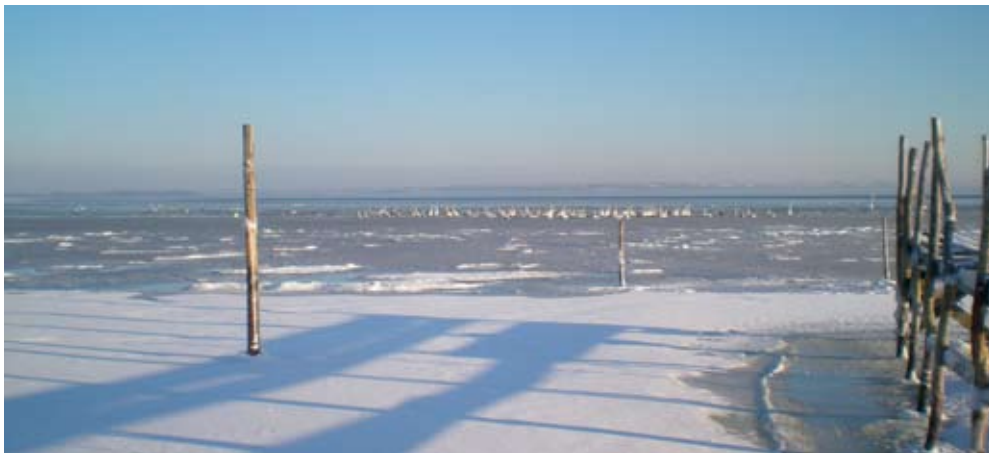
Svaner ved iskanten