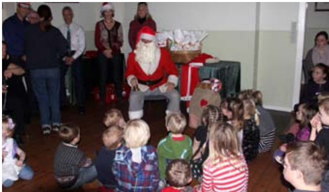
Børnejul i forsamlingshuset

Der kom ikke mindre end ca. 30 børn og ligeså mange forældre og bedsteforældre. En 'professionel' julemand var indforskrevet. Aftenarrangementet havde fristet ca. 50 til fællesspisning. pd