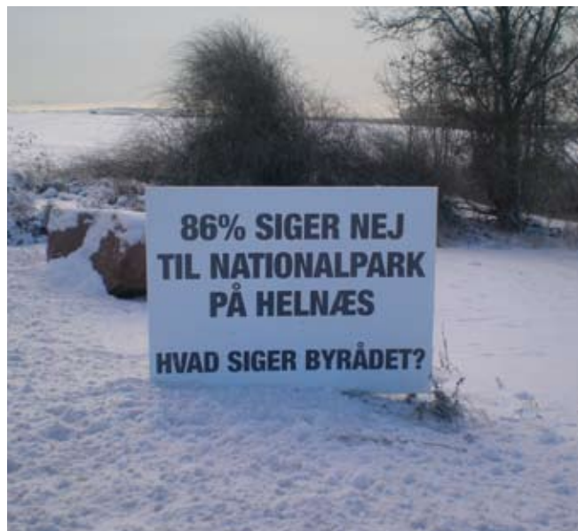
Skilt ved Bobakken

Og vi har klart tilkendegivet i både lokal og fynsdækkende presse, at vi ikke ønsker flere turister her. Vi har nok. Til tider mere end nok. Derfor har vi også sat et skilt op derinde på Bobakken næsten ved siden af vores fine Årets Landsby-skilt, som kan læses af den i bil tilkørende besøgende. På skiltet står: