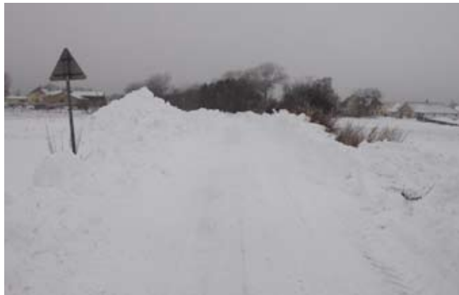
Lindhovedvej mod vest

Heldigvis for os bor der en del landmænd på vejen, som i flere tilfælde lod juleglæden brænde igennem. Vores held var, at Vestergård skulle have