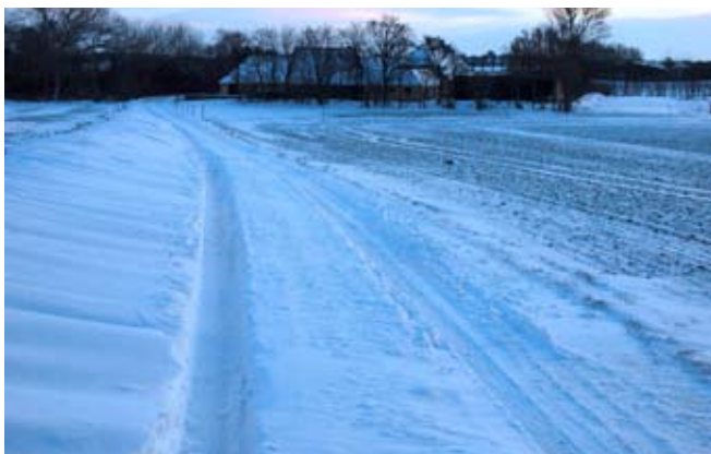
Lindhovedvej mod øst