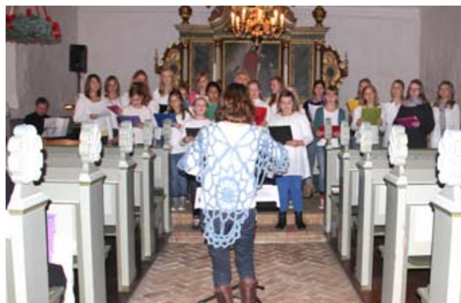
Julekoncert i kirken