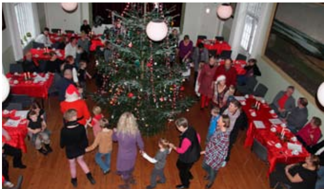
Børnejul i forsamlingshuset