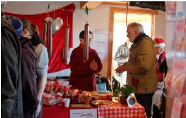
Marked på Møllen