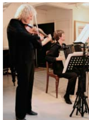
Duo Modus