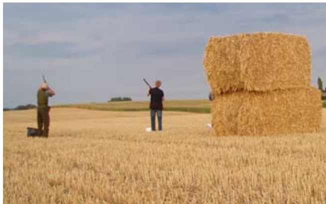
Flugtskydning på åben mark

Flugtskydning var oprindeligt en træning for jægere, men i dag er det en selvstændig sportsgren, som nogen nok kender som skeetkydning f.eks. fra de olympiske lege, hvor Danmark ofte har taget flotte medaljer. Fællesbetegnelsen flugtskydning er gældende, når der skydes med haglbøsse mod flyvende mål – her lerdue – og det er det, der sker på de fire tors-