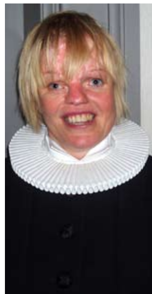
Vikar, Pastor Marlene Andersen