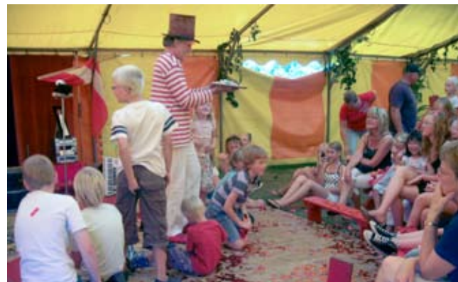
Børnecirkus – børnene morer sig