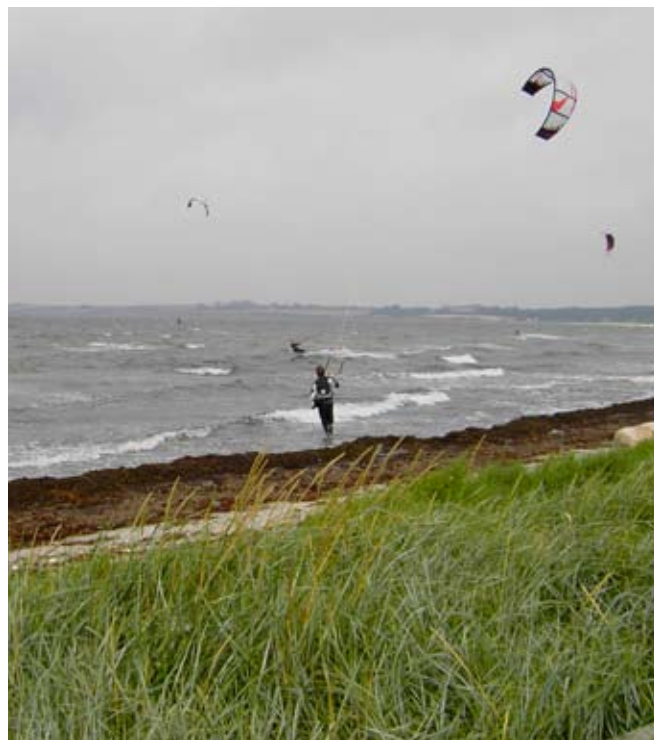
DM Kite-surfing 2009 Brydegård

Disse filosofiske problematikker er slet ikke irrelevant for os på Helnæs. Når jeg fx kører over Langøre, kan jeg godt glæde mig over kite-surferne, der bolter sig på Helnæsbugten. Men jeg kan også ærgre mig over det fugleliv, der er forsvundet som følge af kite-surfing. Den glæde kite-surferne skaber skal således holdes op mod den glæde, de fortrænger. Hvad der er relevant er altså ikke alene kite-surfernes fornøjelse eller min misfornøjelse ved deres aktivitet, men den samlede glæde. Det er således min kite-surfernes, såvel som andres glæde eller mishag, der skal tages i betragtning og totalt set skabe mest mulig glæde. At det er umoralsk eller dobbelt moralsk, at en persons eller en gruppes glæde opfattes som mere vigtig end en andens, kan de fleste nok også tilslutte sig. Men det støder ikke alene de flestes moralske intuition, det er også vanskeligt at argumentere for, at lige præcis min og ligesindedes glæde er mere relevant end kite-surfernes eller omvendt. Relevant er det derimod, hvor meget og hvor mange, der glæder sig over kite-surfing i forhold til, hvor mange der ærgres sig over den. Det er ligeledes relevant, hvem der kan opleve glæde eller det modsatte. For antager vi, at dyr og fugle kan føle glæde eller glædens modsætning, så bliver det meget