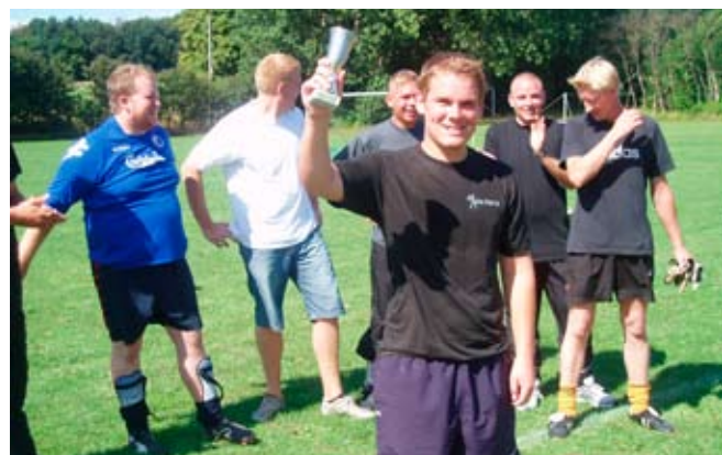
De unge vandt pokalen

Dette års sommerfest blev som tidligere en god oplevelse for de mange fremmødte. »Hvordan er sommeren gået?« og »Hvor har I været henne på ferie?« er typiske sætninger, der hørtes denne