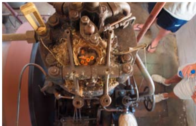
Seks næb skriger om ro og fred