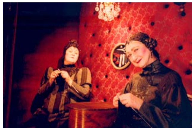
Tante 1 og tante 2 i Skærmydsler