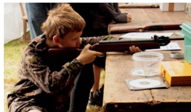
Der sigtes fint