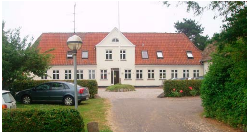
Højskolen på Helnæs, juli 2009

Højskolen på Helnæs står i dag som en af de få folkehøjskoler under Højskoleloven, der har haft en enestående økonomi, frembragt ved en sund og overskudsgivende drift. Det er usædvanligt, idet den deler vilkår med alle andre højskoler, der har haft svære tider og hvoraf mange er lukkede. Ser man lidt ind bag tallene for højskoleudviklingen i Danmark dukker der imidlertid et billede op som viser, at der i 1969 var 72 højskoler, i dag er der 78, altså en fremgang på 6. Hvad er der så at klage over? Det interessante er, at der i perioden har været en meget stor omsætning. Således er 80 – 90 højskoler etableret og lukket. Diskussionen om højskolernes vanskelige tider har således mest haft sit udspring i lukninger, hvorimod etableringer åbenbart er gået mere stille af. Antallet af højskoler har i 10 års perioden fra 1984 til og med 1995 ligget på op til 107 højskoler som det højeste antal. Der har således været en periode i de 40 år, vi vurderer på, hvor der har været grøde og grobund for Grundtvigs