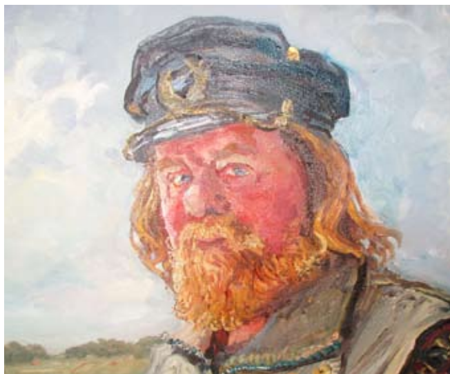
Portræt af "karakteristisk og udtryksfuldt" ansigt