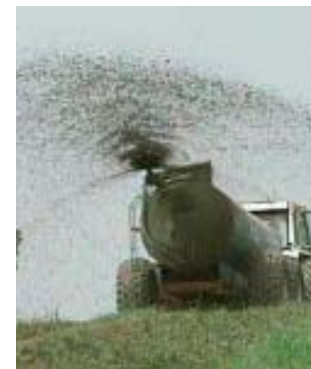
Gyllespreder i funktion

Efter den sidste artikel i avisen (F. St. 23. juni. Hvorfor skal Helnæs drukne i gylle? red.), vil jeg gerne vide, hvorfor man flytter på landet? Der er altid spredt møg og gylle ud. Er det fordi man har lavet så meget ståhej på sin tidligere bopæl, at man ikke var velset? Jeg kan ikke forstå, at alting skal laves om. F.eks. Nye ejere ved stranden lægger sten ud, så der ikke kan vendes, når man skal sætte en båd ud. Nye beboere på Strandbakken: Byskilte, hastighedsskilte, fartkontrol. Sten ved vejkant, som én har ramt på grund af en lastbil kom imod, så undvigelsen kostede dæk og fælge. Næste gang er det måske bilen, der holder efter et sving, der bliver ramt. Flyt den dog. Nu gyllelugten på Stævnevej. Hvad bliver det næste? Jeg er selv tilflytter. Burde jeg lave vrøvl over grise, køer, høns, hunde, der er i snor, kroens madlugt, kørsel med traktor