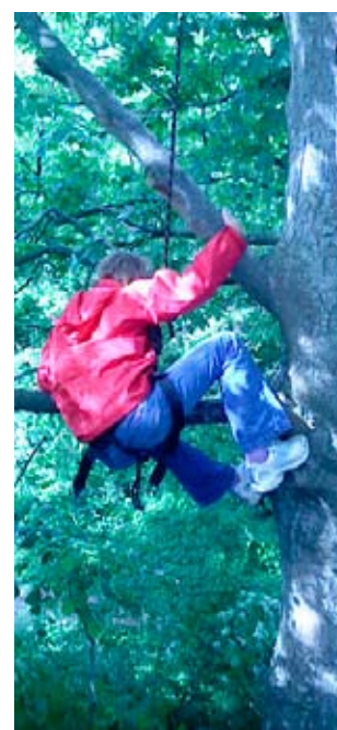
Højt til tops