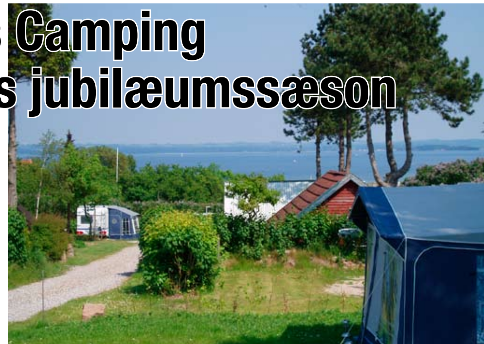
Campingpladsens fantastiske udsigt