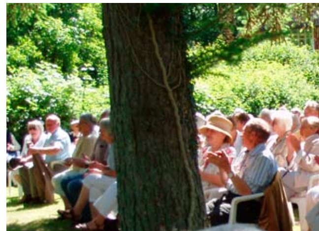
Andægtig lyttende menighed