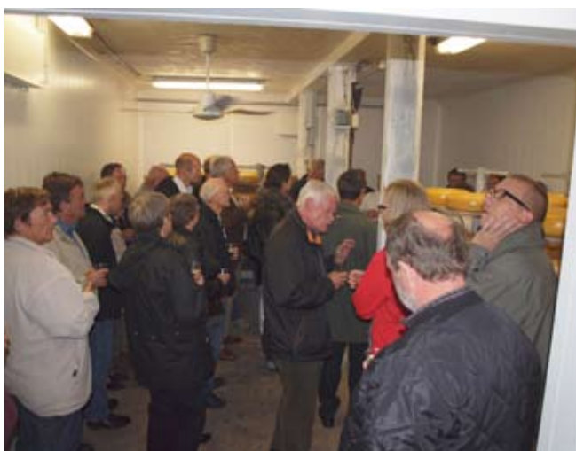
Kneitene med damer på Gundestrup Mejeri

Der var tilmeldt 36 deltagere til udflugten! Efter en forsinket start fra Helnæs kørte vi med bus til Vester Skerninge hvor vi ankom til Gundestrup mejeri og bryghus kl. ca. 19! Det var en blæsende dag, så det var om at komme inden for. Vi blev med det samme budt på øl fra fustage i ostebutikken, og derefter ind til de opstillede borde i produktionslokalerne, hvor der var smagsprøver af ost. Ejeren bød velkommen og fortalte kort om sin egen rolle som mejerist og hans brygmester der stod for ølbrygningen. Efter en rundvisning satte vi os til bords igen og spiste ost og pølsebord af udmærket kvalitet, dertil deres udmærkede pro-