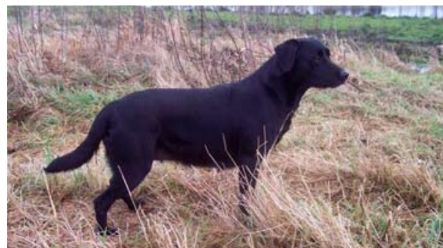
Jagthund – modelfoto

1. »Enhver er pligtig til på alle årets tider, at holde sine husdyr på sit eget«. (Mark- og vejfredsloven § 1) 2. »Uden for byer og områder med bymæssig bebyggelse påhviler det besidderen af en hund at drage omsorg for, at den ikke strejfer om«. (Hundeloven § 3)