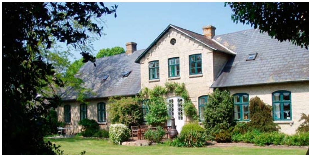
Gudmundsdal – grundlaget for naturgenopretning

I 1997 gennemførte Skov- og Naturstyrelsen Fyn i samarbejde med det tidligere Fyns Amt et naturgenopretningsprojekt i Helnæs Made. Som del af projektet blev vandstanden hævet i 2 delområder, tidligere dyrkede arealer blev udlagt som vedvarende græsningsarealer, og afgræsningen blev sikret på i alt ca. 190 ha. Der blev her ved genskabt en ca. 7 ha stor lavvandet sø, og strandengs-