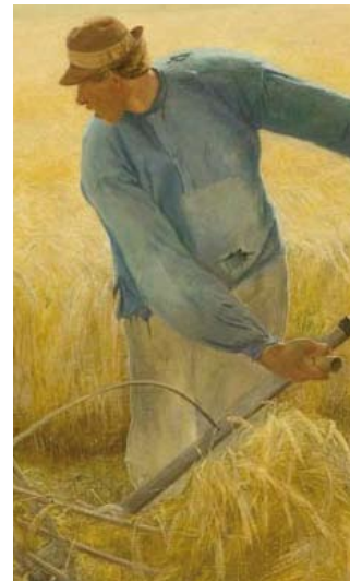
L.A. Ring's berømte billede: I Høst