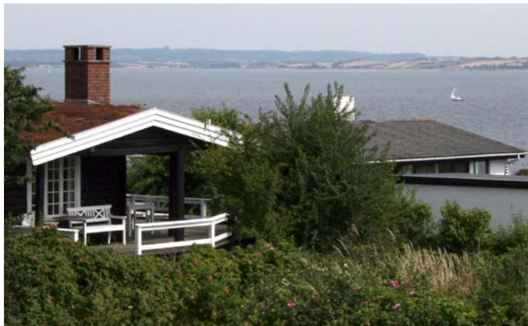
Vue over Helnæsbugten fra Sommerlande

Det er også tydeligt, at der sker noget, når den generation, der var førstegangskøber enten sælger eller overlader