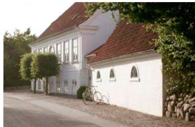
Helnæs gl. Præstegård