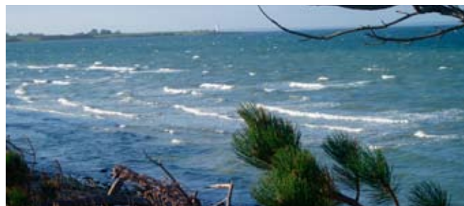
Vue over Lillebælt mod Helnæs Fyr

Der skal nedsættes fire hovedarbejdsgrupper vedrørende natur, kultur, friluftsliv og erhverv og hensigten med deres arbejde er at arbejde med ideer og forslag, der til sidst skal skrives sammen i en nationalparkplan. Planen skal rumme konkrete projekter, som bestyrelsen så skal arbejde for at søge realiseret ved at søge midler til det, hvis det ønskes. Hele tiden er man kun med, hvis man ønsker det. Specielt vil det for det Sydfynske Øhav være naturligt at arbejde med bosætning og erhvervsudvikling – fortsat under hensyn til kultur og natur. Men det er