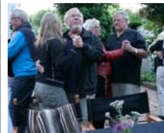
Der danses til jazzmusik

2009 blev året, hvor foreningen kunne glæde sig over, at ca. 400 gæster overværede de 6 koncerter, der blev afholdt. Den syvende planlagte med Duo Rosinante måtte desværre aflyses på grund af en fingerskade hos en af de optrædende kunstnere. Det var også en glad og stolt bestyrelse, der kunne afslutte sæsonen med en velbesøgt opera, operette og musicalaften den 29. august. Her gav Den Fynske Opera med hele 5 optrædende fuld valuta for pengene, for en proppet sal i Helnæs gl. Præstegaard.