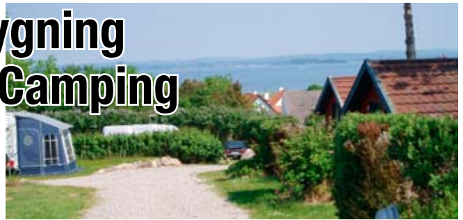
Helnæs Camping i sommer og sol