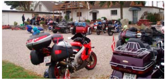
Motorcykler fra MCTC