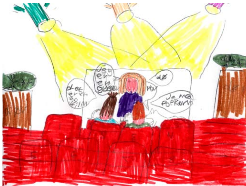
Tegningen er lavet af Lærke, der fylder 8 år den 18. oktober. Vi ønsker tillykke.