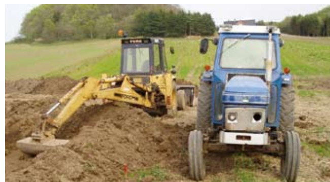
Rendergraver i aktion

Hvem husker ikke i gamle dage, og det er der ikke mange, der gør, da mænd i langskafte læderstøvler og med spidse spader gravede render til kloaker, drænrør og vandledninger. Det er en længst svunden tid, der blev afløst