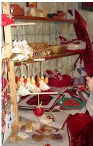
Quiltpigernes juleudsalg

kander, også mere kunstneriske værker har fundet sin plads. I hovedbygningen har Højskolens to af dens ungariske elever en separat udstilling (se portrætsamtalen andetsteds i HelnæsPosten) med hjerner i keramik og mange portrætter af almindelige personer og deres individuelle påklædning. No-