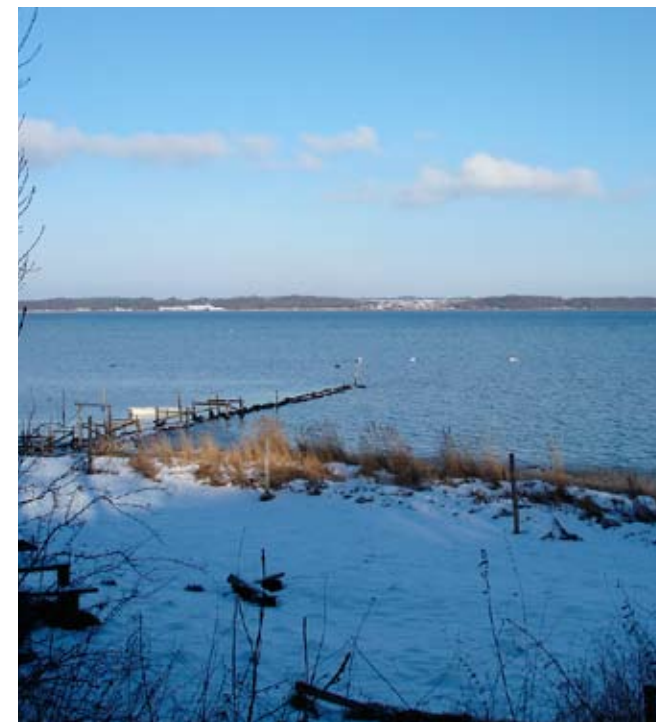
Vinterbillede fra stranden

Benyttelsen af trappen er juridisk kun en ret for fastboende Helnæsboere, idet det er dem, der ved hævd, har vundet en ret ved at gå der. Allerede nu kan vi slå fast, at der er og har været en sti i mange år, men det kan vist også slås fast, at den ikke kunne bruges til transport af de skibsladninger, der er blevet landet på kysten nedenfor eller ved udførsel af landbrugets produkter. Der til har den været for stejl og for smal. Vi vil i næste artikel se på, hvorledes sammenhængen mellem stranden og stien kan tænkes at have været. Vi vil også prøve at give svar på hvorfor, der blev bygget en ejendom af en vis størrelse på netop dette sted og hvorfor en sti