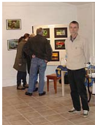
Fotoudstilling på Gammelgaard