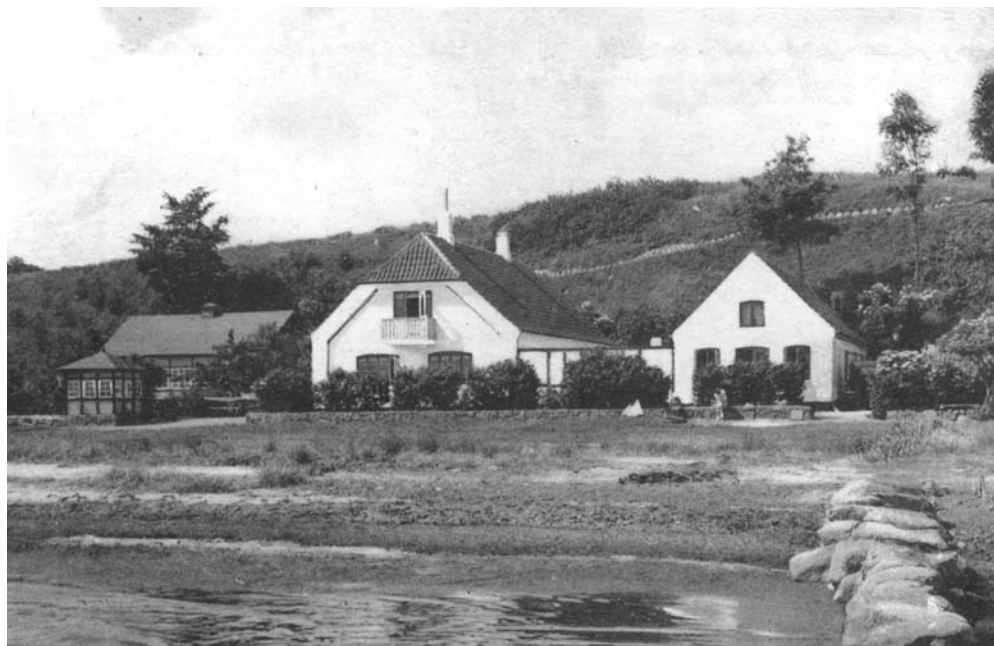
Helnæshus med stien på skrænten

For mange, der jævnligt har gået ture langs stranden og op i Klinteskovens er forceeringen af skrænten foregået lige efter skovens begyndelse. Det var den vej, man kendte til. At gå bag om Helnæshus og videre til skoven, er ikke faldet mange uden om ind. Der er ikke mange, der har tænkt på, at der faktisk var en sti til brug for kirkegængere, dvs. for ganske få fastboende Helnæsboere fra Strandbakken. Der er tale om to helt forskellige ærinder: At gå til kirke, og gå tur i skoven. Hvad angår betegnelsen "kirkesti" ligger det ikke lige for, når man spørger rundt. Nogle kalder