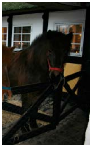
Hestene i Antikkens gård

Efter et kort besøg i Helnæs Antik, der i dagens anledning havde fået hestene ind