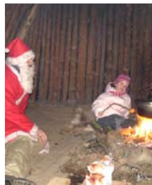
Nissen i hulen på møllen

I julemandens hule i det ene hjørne af Møllens store udeareal har julemanden sat os stævne til en god julefortælling og æbleskiver. Da vi ankommer, er der dejligt varmt i hulen og ilden blusser lystigt. Julemanden fortæller om sine juleforberedelser og fortæller bl.a. at han nu er 614 år gammel og at han ikke