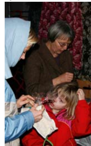
Nostal(d)gis hyggelige julestue

På vej gennem mørket til Kildegården tænkte vi, at tiden dog var fløjet af sted og nu var klokken tæt på kl.