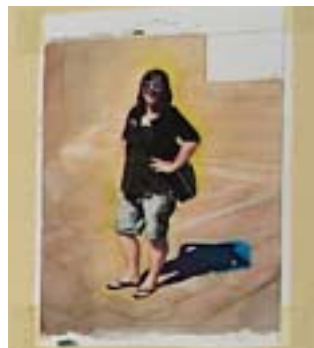
Klaras Akvareller på Højskolen

kander, også mere kunstneriske værker har fundet sin plads. I hovedbygningen har Højskolens to af dens ungariske elever en separat udstilling (se portrætsamtalen andetsteds i HelnæsPosten) med hjerner i keramik og mange portrætter af almindelige personer og deres individuelle påklædning. No-