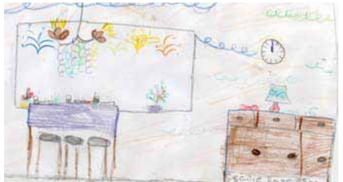
Billede tegnet af Cecilie Rasmussen, Stævnevej 14, 9 år

Line fortæller handlingen: En klasse børn må ikke få juleferie for deres lærer. Han hedder Granberg og han hader julen. Så kommer der nogle nisser og driller ham. De tager hans madpakke, hans kridt, hans briller og hans taske. Alle børnene kalder på nisserne, de kommer frem, og så får Granberg sine ting igen. Han bliver glad, og så får børnene juleferie.