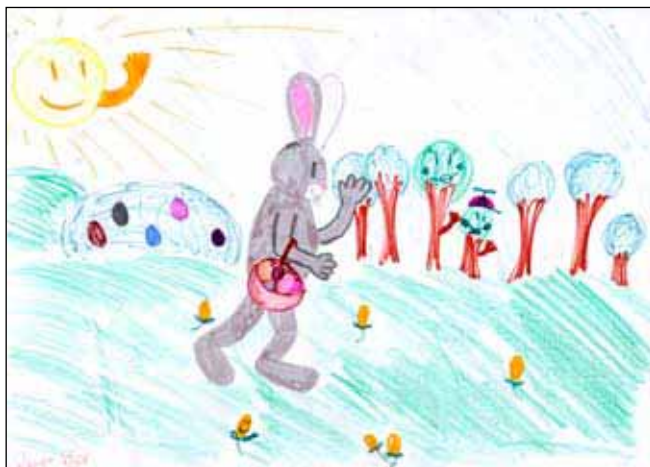
Tegnet af Olga Theime